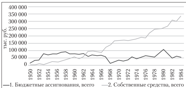
Рис. 1. Основные источники финансирования и капвложений 1950–1985 гг. Источник: Гишатуллин М.К. Развитие «Татнефти» // Статистика и комментарии. М., 2000. С. 91–94