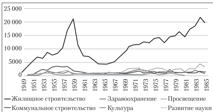
Рис. 2. Объемы государственных капитальных вложений непроизводственного назначения (тыс. руб.). Источник: Гишатуллин М.К. Развитие «Татнефти» // Статистика и комментарии. М., 2000. С. 113.

Таким образом, социальная сфера создавалась не только за счет государственных капиталовложений; на протяжении всего рассматриваемого периода вклад собственных средств Объединения в непроизводственную сферу был небольшим. Это подтверждается корреляцией между динамикой капвложений и процессом ввода социальных объектов.