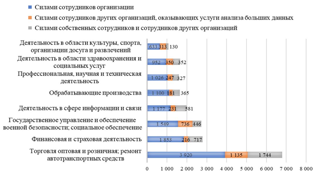
Рис. 2. Организации, проводившие анализ больших данных в 2021 г., распределенные по видам деятельности в зависимости от способа проведения анализа