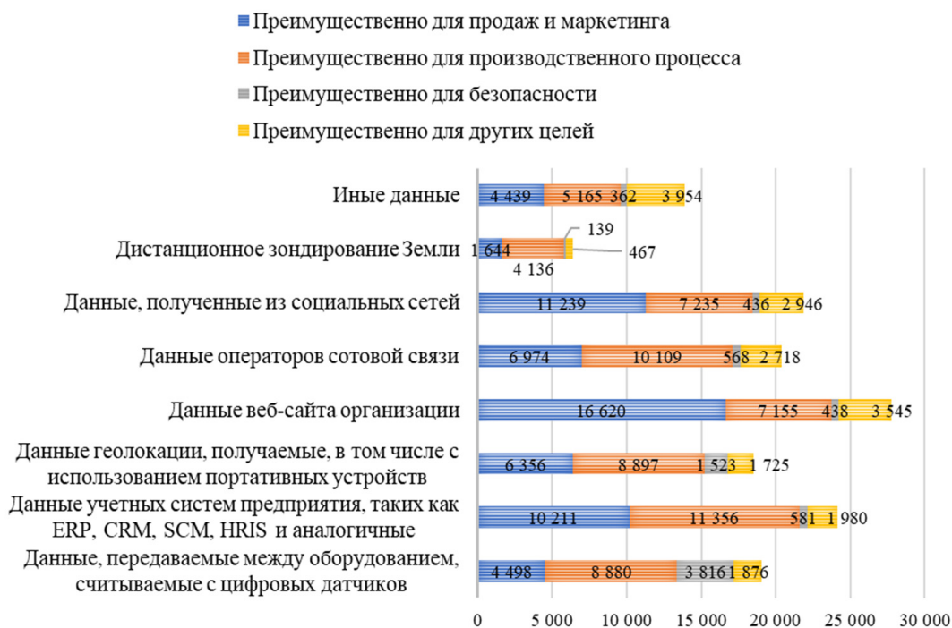
Рис. 4. Количество компаний по направлениям использования технологий сбора, обработки больших данных в 2021 г.