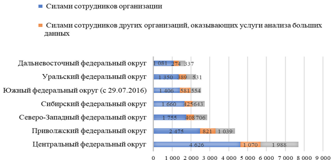
Рис. 1. Организации, проводившие анализ больших данных в 2021 г., распределенные по территориальному признаку в зависимости от способа проведения анализа, ед.